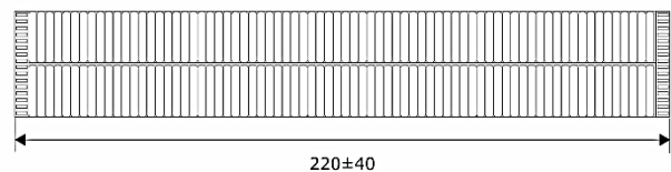
Рис.1. Основные размеры изделия мед. шапочка «Шарлотта»